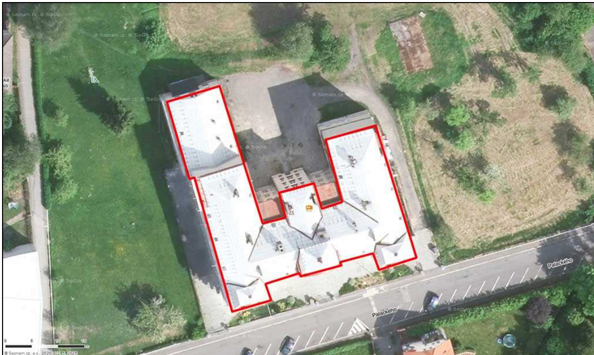
Letecký snímek posuzované budovy základní školy a gymnázia v České Kamenici (označena červeně).

Posuzována byla budova základní školy a gymnázia v České Kamenici (dále jen budova) rozkládající se na adrese Palackého 535, 407 21 Česká Kamenice, okres Děčín (souřadnice WGS: 50.7982597 N, 14.4192264 E).